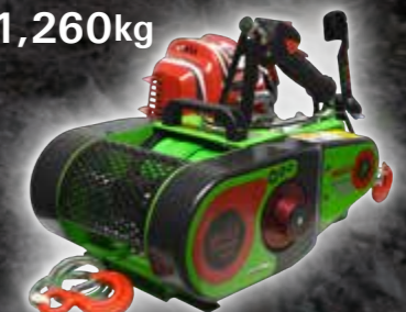
VF155 AUTO-4 GX50