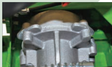
高精度ヘリカルギア採用により 高耐久性を確保