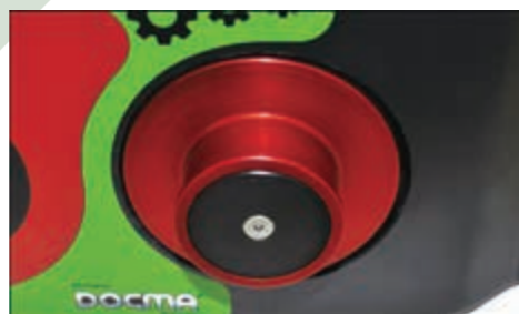
革新的なロープ巻取り部 クイックリリース機構

VF155 automatic ultralight はイタリアDOCMA社の長年の研究によって開発された、画期的な巻き取り式エンジンウインチです。鉄製ワイヤーロープが標準仕様だった従来機種を、牽引性能を落とさず徹底的に使い易かつ大幅な軽量化を実現しました。その為に新たに開発された破断強度3トンクリアする新素材ロープにより、ロープ80mとフックを含む総重量が25kgという軽さです。また柔らかな新素材繊維ロープの採用による簡易的な手袋でのイーザーハンドリングと、自動巻取り機構組込みによるロープの巻取り不具合を解消しました。勿論、ロープを伸ばす場合はクイックリリース方式です。VF155 automatic ultralight は、重量物を扱う現場での、安全確保および負担軽減と時間の節約に大きく貢献します。